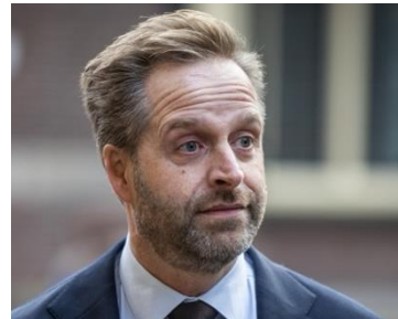
Hugo de Jonge